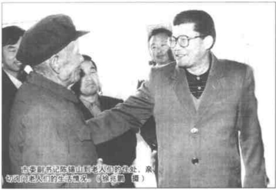
市委副书记陈锡山到老人们的住处，亲切地向老人们的生活情况。

下镇乡敬老院始建于1991年10月，集中供养了10名五保老人。市委书记国家森十分关心老人们的生活问题，到下镇乡检查指导工作，他经常走访慰问敬老院的老人，亲笔为敬老院书写院名，并要求乡党委、政府尽量提高五保老人的集中供养率。市委拨款12万元，市、县民政部门配套资金8万元，于今年3月开始进行敬老院扩建工程。在乡党委、政府和全体驻下镇市直机关下派干部的共同努力下，扩建工程10月底顺利完工。市直机关驻下镇乡20名包乡、包村干部每人捐款400元，集体为老人们购买了一台彩电和一套音响设备，丰富了老人们的文化生活。目前，该敬老院已集中供养老人17名。