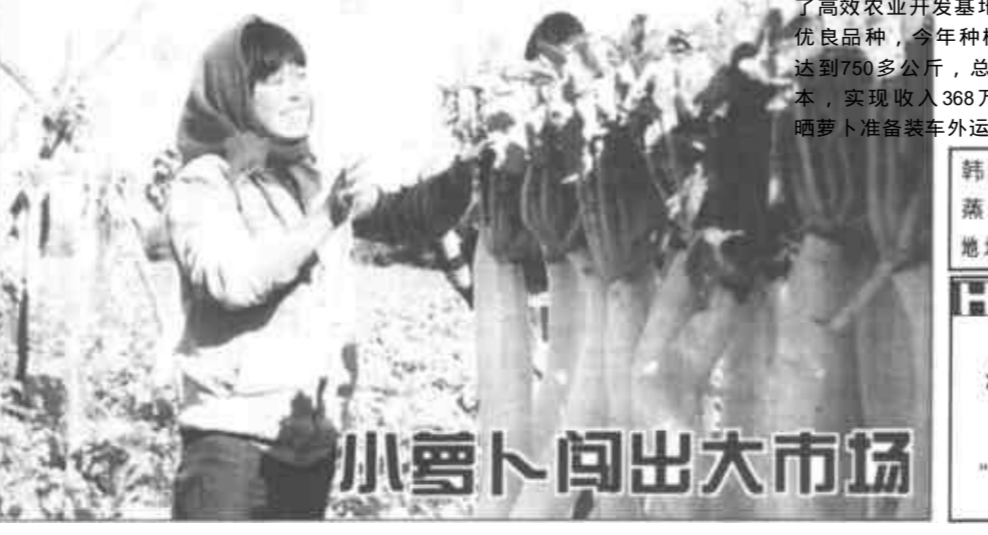
小萝卜闯出大市场